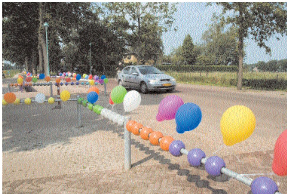
Ontwerp: Wia van Dijk

Speelruimte Vanaf 2005 heeft Gemeente Haren met een lokale werkgroep gewerkt aan de herinrichting van de Zuidlaarderweg in Noorderlaren. Daarbij is de omgeving van de dorpsschool ingericht volgens de principes van Shared Space. De wens van de gemeente was om de school zichtbaarder te maken door de weg die pal langs het schoolplein liep en het schoolplein samen te trekken. Een lastige hobbel was de onderwijswetgeving die bepaalt dat een schoolplein duidelijk afgebakend moet worden met een hek. Om tot een creatieve oplossing te komen is de school een kunstproject gestart waarbij de kinderen samen met een kunstenares ontwerpen hebben gemaakt voor een markering van de plek. Het resultaat is een vrolijk telraam en enkele bankjes langs de weg. Een uil op het bankje is een knipog naar de wijsheid van de automobilist. Voor het kunstproject kon de gemeente een beroep doen op aanvullende middelen vanuit Onderwijs.